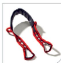
Cinturón Raiser +