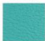
16 VERDE TURQUESA