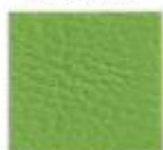
18 VERDE MANZANA