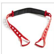
Cinta Molift Assist con manguito deslizante

Asiste al usuario en la acción de erguirse y sentarse. Apoyo durante las transferencias.