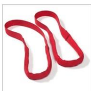
Asas flexibles Molift. Pack 2 uds Ayudan al usuario a alcanzar el manillar.