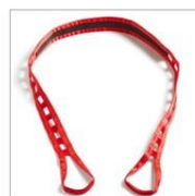
Cinta Molift Assist

Cinta de seguridad para apoyo y seguridad adicionales.