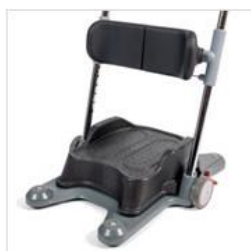
Plataforma elevación para Molift Raiser Pro

Para usuarios que necesitan una posición más elevada