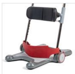
Cinta talones para Molift Raiser Pro

Apoyo para mantener los pies del usuario en la posición correcta